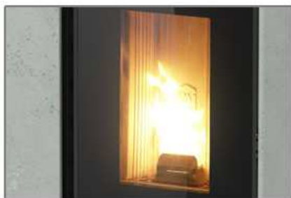
ampia visibilità della fiamma wide view of the flame

STUFE COMBinate LEGNA E PELLE COMBINED WOOD AND PELLE STOVE