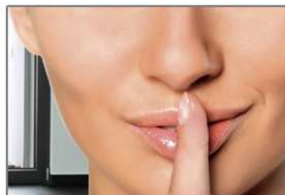
funzione silent silent function