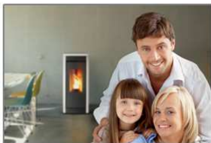
valvola di sicurezza safety valve