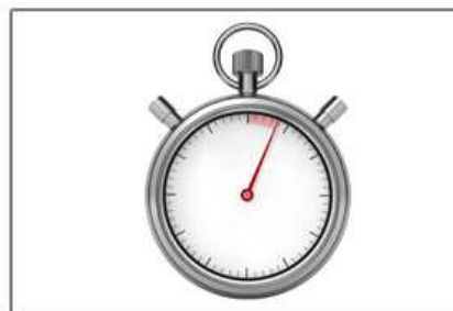
resistenza in ceramica ceramic resistance