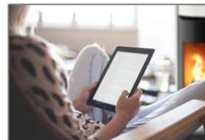
motoriduttore continuo continuous gear motor