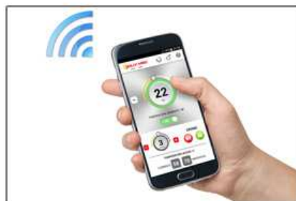
dispositivo WI-FI WI-FI device