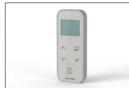
radiocomando touch touch remote control